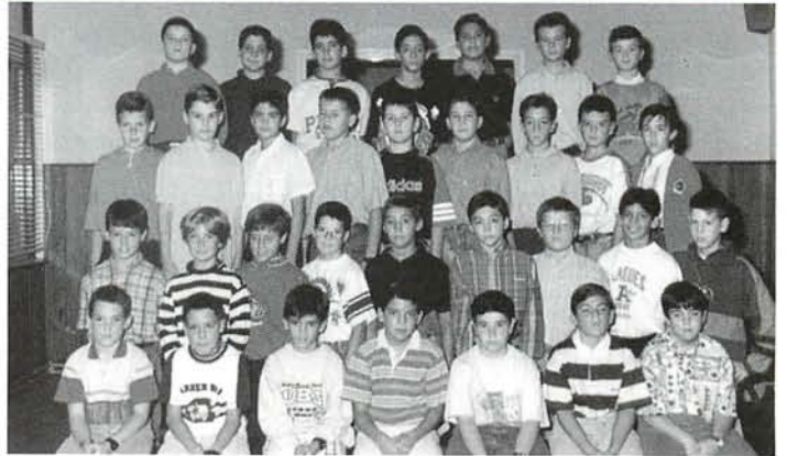
Comenzarán a estudiar un segundo idioma. 6º B.

El primer calendario de aplicación de la LOGSE contemplaba un periodo de 10 años para la aplicación total de la reforma educativa (desde el curso 91-92 hasta el curso 99-00).