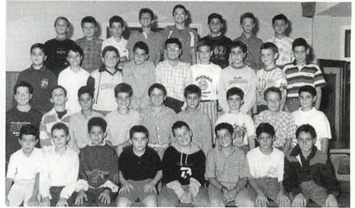
Los alumnos de sexto de Educación Primaria estrenarán la ESO. 6º A.

No. Todos los programas educativos son nuevos y, por tanto, los libros también. De todas formas, siempre es bueno conservarlos y utilizarlos como material de consulta.