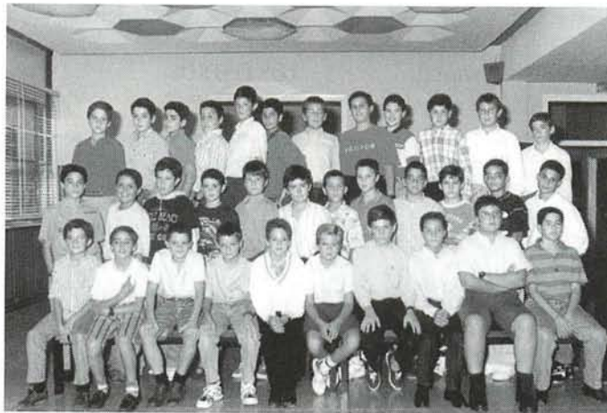
Tendrán más asignaturas optativas. 6º C

Las obras de infraestructura necesarias ya fueron aprobadas por el Ministerio y, en este momento, están concluidas. Por otra parte, los profesores continúan trabajando, en reuniones semanales, para tener listas todas las programaciones antes de comenzar el curso 96-97.